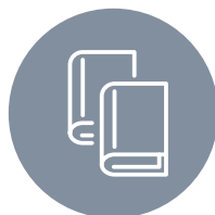
SCHULEN UND UNIVERSITÄTEN