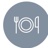
SEMINAR- UND VERANSTALTUNGS- RÄUME