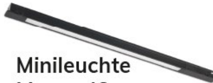
Minileuchte Linear 42cm