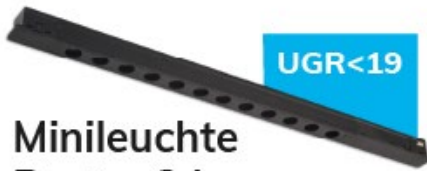
Minileuchte Raster 34cm